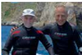
Admetlla y Castellvi